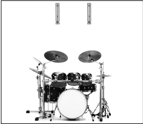
In this diagram, two WA-84's are used in a spaced pair configuration to record stereo drum overheads.